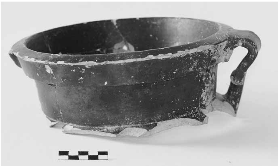
Εικ. 13. Τμήμα μελαμβαφούς λακωνικού κρατήρα (τομή 26-10β).