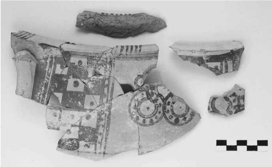
Εικ. 15. Θραύσματα λέβητα με γεωμετρικά μοτίβα (αρ. ευρ. Κ2000Α.523, τομή 23-12β).

κυριότερα εργαστήρια. Ανάμεσα στα «ντόπια» αγγεία ξεχωρίζουν τα λεγόμενα «ασημίζοντα» αγγεία —από τα πιο ευδιάκριτα κεραμικά προϊόντα της περιοχής του Θερμαϊκού κόλπου— κατά το πλείστον μεγάλων διαστάσεων 32 , οι οινοχόες με διακόσμηση από πλατιές καστανές ταινίες, οι σιλβωτές οινοχόες-«κολοκύθες» 33 , οι υδρίες, οι λέβητες με γεωμετρικά μοτίβα (εικ. 15), τα σταμνοειδή και τα μαγειρικά αγγεία και τέλος τα «ιωνίζοντα ωοκέλυφα» αγγεία στα οποία θα αναφερθούμε και πιο κάτω.