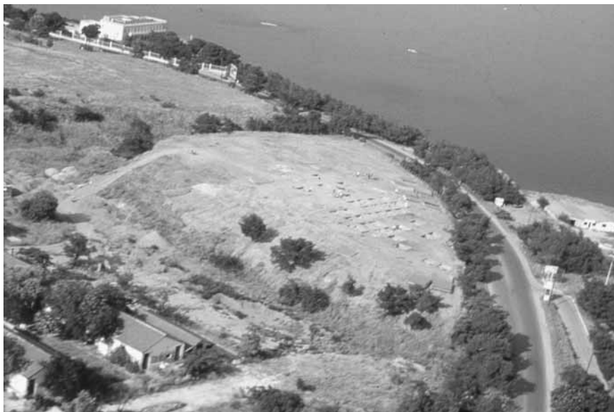
Εικ. 1. Αεροφωτογραφία του ανασκαφικού χώρου και της γύρω περιοχής στο πρώην στρατόπεδο Κόδρα, Καλαμαριά.

τακινούμαστε προς τα βόρεια, δηλαδή προς το κέντρο και την κορυφή της τούμπας, η διατάραξη γίνεται ολοένα και μεγαλύτερη και συχνά παρατηρείται ολοκληρωτική καταστροφή των αρχαιοτήτων. Όπως είναι επόμενο, το τμήμα αυτό δέχτηκε και τις περισσότερες επεμβάσεις κατά τη διάρκεια του 20ού αιώνα, γεγονός που υπήρξε καταστροφικό για τα αρχαία του χώρου.