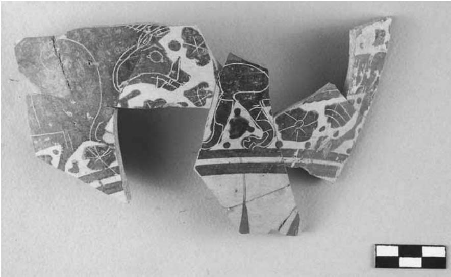
Εικ. 12. Αποσπασματική «κορινθιάζουσα» κοτύλη με ζώα (τομή 23-1γ).