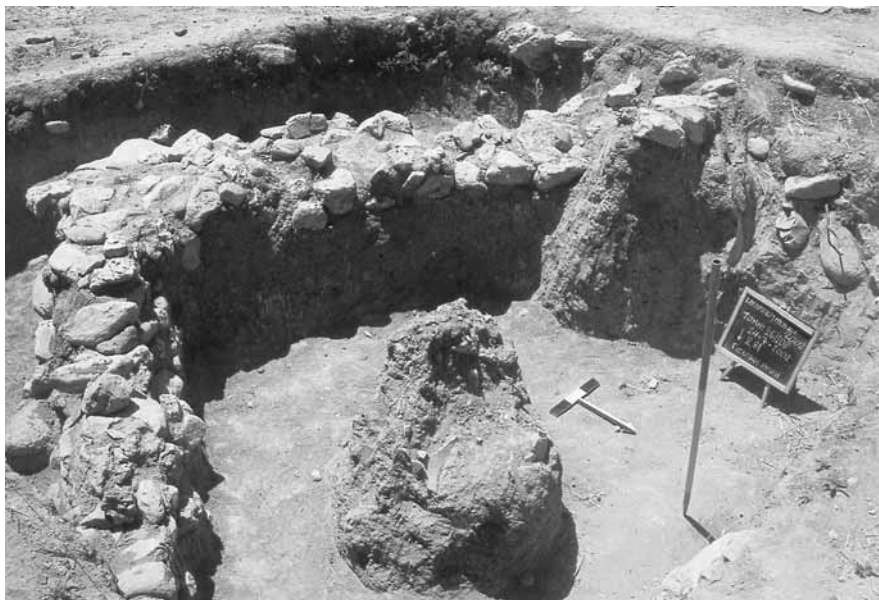
Εικ. 3. Πιθεώνας στην τομή 26-10β (λήψη από ΒΑ).