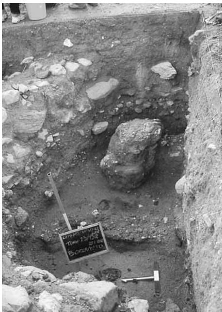
Εικ. 5. Λεπτομέρεια «βοτσαλωτών» με αδιατάρακτο στοίωμα ανάμεσά τους στην τομή 23-13α.