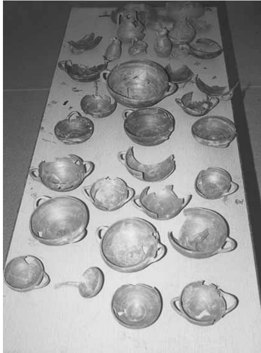
Εικ. 18. Δείγμα «ιονίζουσας ωοκέλυφης» κεραμικής από την κυψελόμορφη κατασκευή της τομής 27-79δ.

σημειώτες ποσότητες. Η τελευταία διαπίστωση ισχύει και για τα περισσότερα από τα σύνολα των οστράκων που βρίσκουμε στο Καραμπουρνάκι.