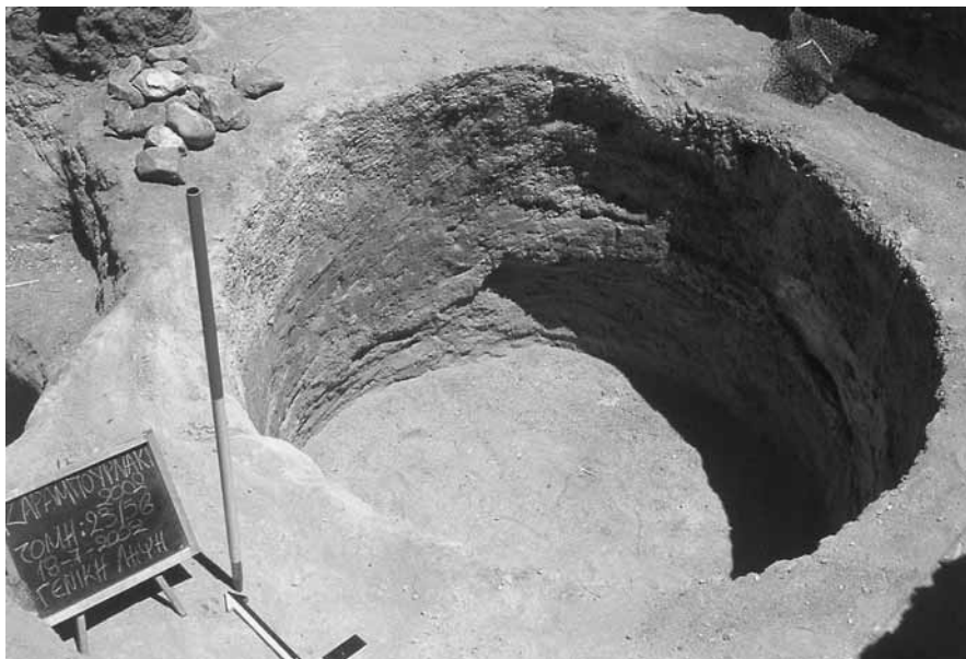
Εικ. 4. Κυφελόμορφη ημιυπόγεια κατασκευή στην τομή 23-5β (λήψη από ΝΔ).

χρονες μεταξύ τους 13 . Μπορεί ακόμη να θεωρηθεί ότι αποτελούν τμήματα των πρώτων οικοδομικών φάσεων του οικισμού, καθώς το χαμηλότερο τμήμα τους φτάνει μέχρι το σκληρό «λευκό» φυσικό έδαφος της περιοχής, τη λεγόμενη «μέλαγga» 14 . Ομοιομορφία παρατηρείται επίσης και στο γέμισμά τους. Είναι όλες γεμάτες με μαλακό χώμα το οποίο περιέχει οστά και όστρακα και άφθονη κεραμική εισαγμένη και εγχώρια. Αργοί λίθοι αλλά και κομμάτια εστιών και ίχνη καύσης εντοπίστηκαν σε αρκετές από αυτές.