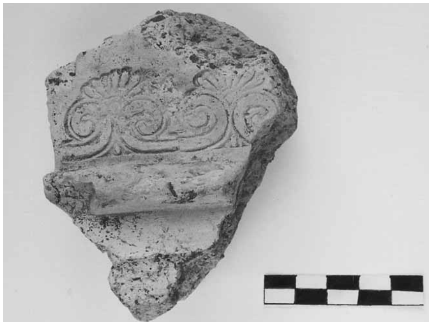
Εικ. 11. Τμήμα κορινθιακού περιρραντηρίου με εμπύεστα ανθέμια (τομή 23-13α).

τεχνοτροπική όσο και από εικονογραφική άποψη. Μεμονωμένο είναι προς το παρόν ένα τμήμα από κορινθιακό περιρραντήριο με εμπύεστα ανθέμια (εικ. 11).