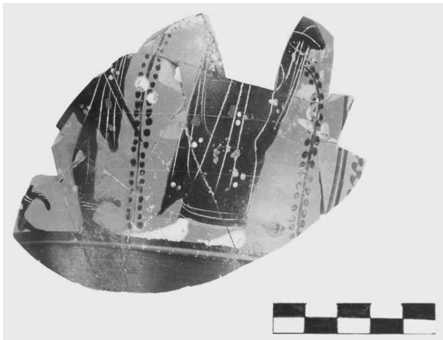
Εικ. 14. Αποσπασματική αττική μελανόμορφη οينوχόη (τομή 26-10β).

Τα περισσότερα αττικά μελανόμορφα αγγεία ανήκουν στα τέλη του 6ου και τις αρχές του 5ου αι. π.Χ. (εικ. 14), αλλά υπάρχουν σποραδικά και παλιότερα αττικά όστρακα από το πρώτο μισό του 6ου αι. π.Χ. Λίγα είναι τα όστρακα που προέρχονται από αττικά ερυθρόμορφα αγγεία του 5ου αι. και από αττικά μελαμβαφή του 5ου και του 4ου αι. π.Χ. 30