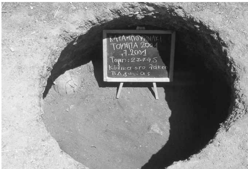
Εικ. 7. Κυνελομορφη ημιυπόγεια κατασκευή στην τομή 27-79δ γεμάτη με «ιονίζουσα ωοκέλυφη» κεραμική.

σε διαφορετικά μεταξύ τους επίπεδα 19 (εικ. 6). Τα δύο αυτά λιθόστρωτα φαίνεται να σχετίζονται με τους τοίχους που βρίσκονται γύρω τους (το ψηλότερο με τον μεγαλύτερο και καλύτερα σωζόμενο, ενώ το χαμηλότερο με τους άλλους τρεις τοίχους της τομής) και αποτελούν κατασκευές διαφόρων χρήσεων ή στρώσεις δρόμων 20 . Αν μάλιστα ισχύει το δεύτερο, θα είναι η πρώτη φορά που εντοπίζεται δρόμος στον αρχαίο οικισμό.