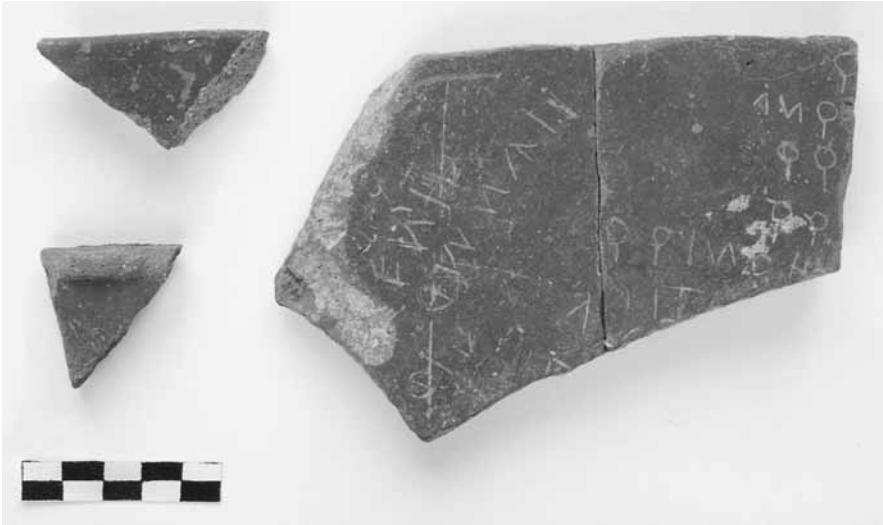
Εικ. 20. Ενεπίγραφη κεραμίδα (τομή 26-10β).

Καραμπουρνάκι 38 , ενώ έχουν βρεθεί και σε γειτονικούς οικισμούς της περιοχής του Θερμαϊκού, όπως στην Τούμπα Θεσσαλονίκης, στη Σίνδο, στην Τράπεζα Λεμπέτ στη Σταυρούπολη, στη Νέα Φιλαδέλφεια και στη σύγχρονη Θέρμη 39 .