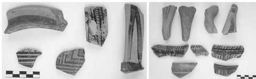
Εικ. 8. Εισαγμένη και ντόπια γεωμετρική και υπογεωμετρική κεραμική από το αδιατάρακτο στρώμα της τομής 23-13α.

τητα εισαγμένων γεωμετρικών και υπογεωμετρικών οστράκων (εικ. 8) κυρίως από ευβοϊκούς σκύφους διακοσμημένους με ομόκεντρα ημικύκλια, μαζί με πολλά «ντόπια» όστρακα της λεγόμενης Εποχής του Σιδήρου, κυρίως από φιάλες και οινοχόες αλλά και από αμφορείς με γραπτή γεωμετρική διακόσμηση 25 .