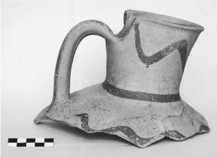
Εικ. 16. «Ιωνίζουσα» αποσπασματική οinoχόη (αρ. ευρ. K2001.81, τομή 27-89β).

για «ιωνίζοντα» αγγεία (εικ. 16), μη μπορώντας να προσδιορίσουμε ακόμη με ακρίβεια τον τόπο παραγωγής τους. Τα περισσότερα «ντόπια» αγγεία ξεχωρίζουν από τον ανοιχτό καστανό πηλό που περιέχει πολλή μίκα και η επιφάνειά τους καλύπτεται με πορτοκαλέρυθρο ή καστανόμαυρο επίχρυσμα, πολλές φορές άνισα επαλειμμένο, ενώ συχνά διακοσμούνται με συστάδες από γραπτές ταινίες.