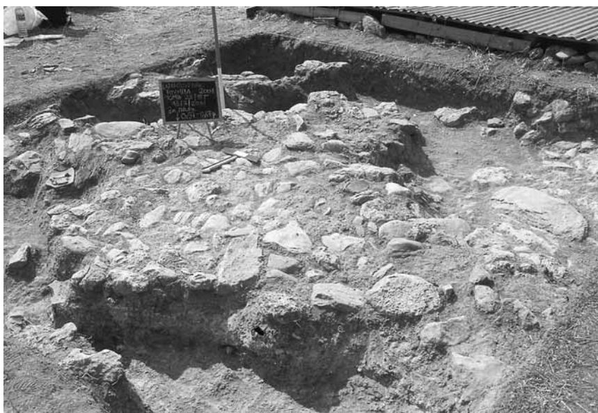
Εικ. 6. Συγκέντρωση λίθων στην τομή 23-5γ.