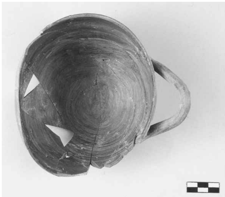
Εικ. 19. «Ιωνίζουσα ωοκέλυφη» κύλικα με παραμορφωμένο σχήμα από την τομή 27-79δ.

κές ατέλειες (εικ. 19) και είχαν πεταχτεί μαζί με ποσότητες αργιλώδους χώματος και άψητα τμήματα αγγείων στην ημιυπόγεια κατασκευή 36 . Όλα αυτά συνηγορούν ότι εδώ έχουμε τα απορρίμματα ενός κεραμικού εργαστηρίου, τη θέση του οποίου θα πρέπει να αναζητήσουμε στον αρχαίο οικισμό 37 . Σχετικά με τη χρονολόγηση του συνόλου, τα λιγοστά άλλα κεραμικά συννευρήματα (όστρακα υπογεωμετρικού κρατήρα και σκύφου, χιώτικων αμφορέων κ.ά.) μας επιτρέπουν να το τοποθετήσουμε στα αρχαϊκά χρόνια. Τέτοια αγγεία ήταν ήδη γνωστά και από τις προηγούμενες χρονιές των ερευνών μας στο