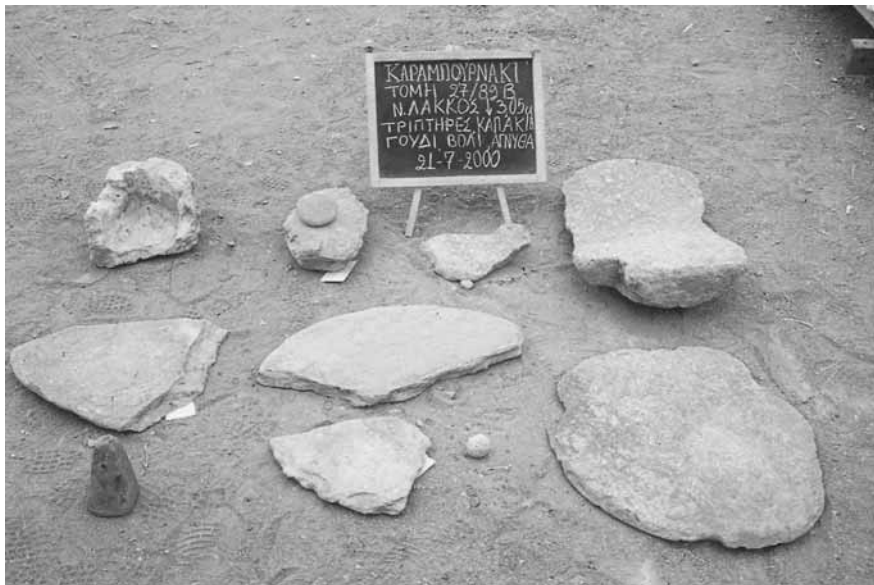
Εικ. 17. Λίθινα αντικείμενα (καπάκια, τριπτήρας, ιγδίο, «βλήμα») και πήλινη αγνύθα (τομή 27-89β).

ρεί, με τον καλύτερο τρόπο, το παράδειγμα της τομής 27-89β, η οποία ανασκάφηκε κατά το 2000 34 . Ο χώρος της ημιυπόγειας εδώ κατασκευής έδωσε μεγάλο αριθμό τόσο λίθινων αντικειμένων (καλύμματα πίθων, μυλόπετρες, τριπτήρες, ιγδία, πεσσούς σφενδόνας) όσο και χαρακτηριστικών πήλινων (κεραμίδες, αγνύθες, καμένα λυχνάρια, όστρακα αγγείων) (εικ. 17).