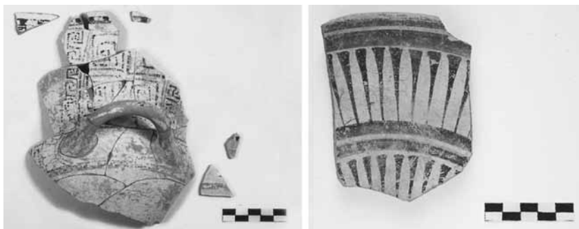
Εικ. 9. Χιώτικος κάλυκας (τομή 23-12β) και πινάκιο Ανατολικής Ελλάδας (τομή 22-94δ).

Στην αρχαϊκή περίοδο τα εισαγμένα από την Ανατολική Ελλάδα αγγεία, ήδη από τον 7ο αι., διακρίνονται για την ποιότητα και τη μεγάλη ποικιλία των σχημάτων τους. Ως πιο χαρακτηριστικά (εικ. 9) αναφέρουμε τις κύλικες με πουλιά, οινοχόες του ρυθμού των αιγώνων, κρατήρες, λέβητες, πινάκια, χιώτικους κάλυκας, ιωνικές κύλικες και σαμιακές ληκύθους 26 . Εδώ μνημο-