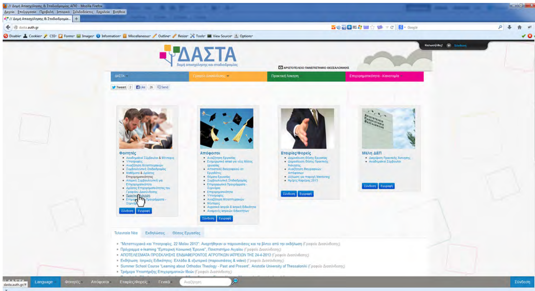
Εικόνα 1. Αρχική εικόνα συστήματος ΔΑΣΤΑ

Ο φοιτητής ή η φοιτήτρια προκειμένου να διαχειριστεί την αίτηση και να παρακολουθήσει την πορεία της Πρακτικής Άσκησης της Σχολής/Τμήματος που ανήκει εισέρχεται στο http://dasta.auth.gr (Εικόνα 1)