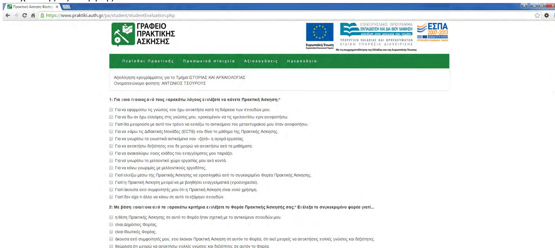
Εικόνα 11. Αξιολόγηση του προγράμματος

Την επόμενη ημέρα από τη λήξη της πρακτικής άσκησης ενεργοποιείται η αξιολόγηση του προγράμματος από τους φοιτητές και της φοιτήτριες. Προκειμένου να συμπληρώσουν την αξιολόγηση οι χρήστες επιλέγουν από το μενού την επιλογή Αξιολόγηση . Ο χρήστης συμπληρώνει την αξιολόγηση και πατά στο κουμπί «Αποθήκευση» προκειμένου να αποθηκευτούν τα στοιχεία της αξιολόγησης