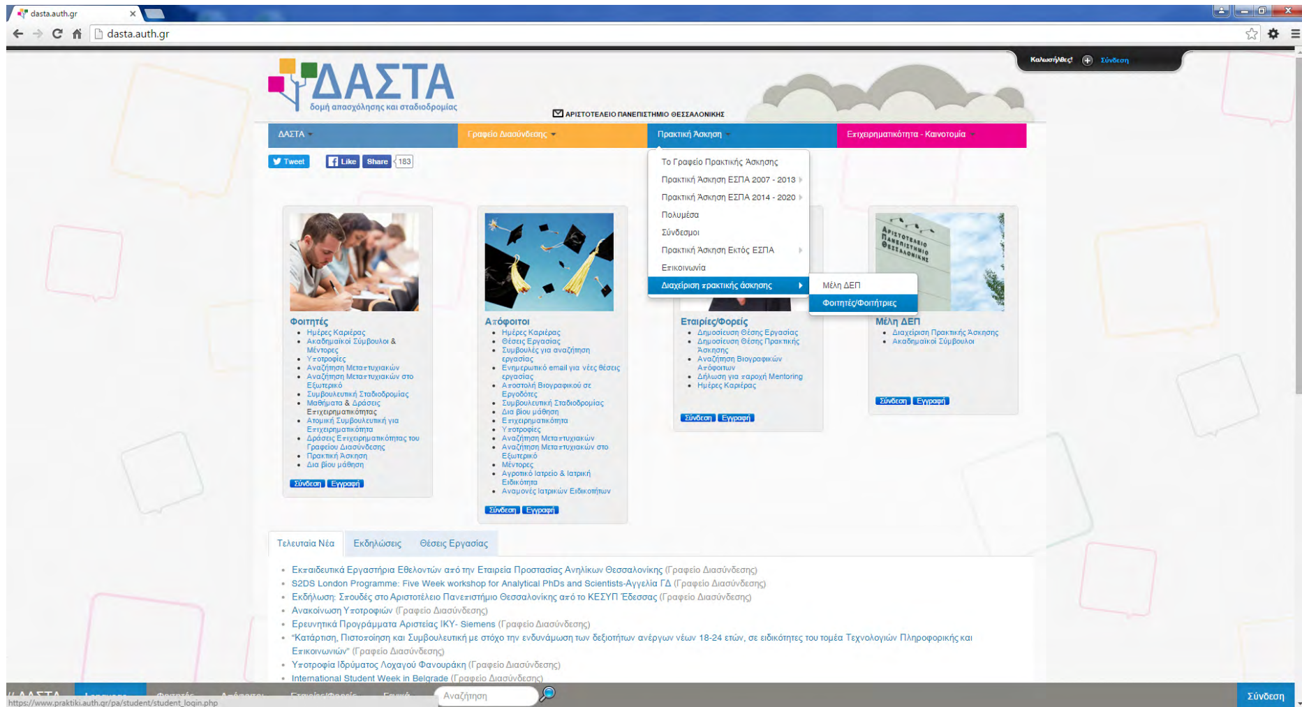
Εικόνα 2. Επιλογή σύνδεσης στη διαχείριση πρακτικής άσκησης

Κάνοντας κλικ στην πράσινη επιλογή Πρακτική Άσκηση και επιλέγοντας Διαχείριση Πρακτικής Άσκησης και έπειτα Φοιτητές/Φοιτήτριες (Εικόνα 2) ο χρήστης ανακατευθύνεται σε σελίδα του Κέντρου Διαχείρισης Δικτύου και εισάγει τα στοιχεία του Ιδρυματικού Λογαριασμού δηλαδή το όνομα χρήστη και τον κωδικό που χρησιμοποιεί και στο email του (Εικόνα 3).