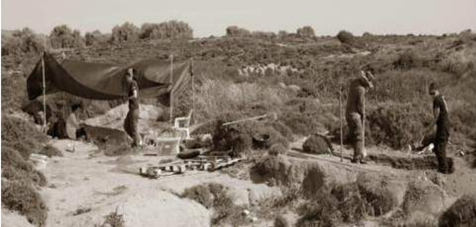
Η ανασκαφή της Παλαιολιθικής εγκατάστασης του 'Ούριακου' στη Λήμνο (11η χιλ. π.Χ.)