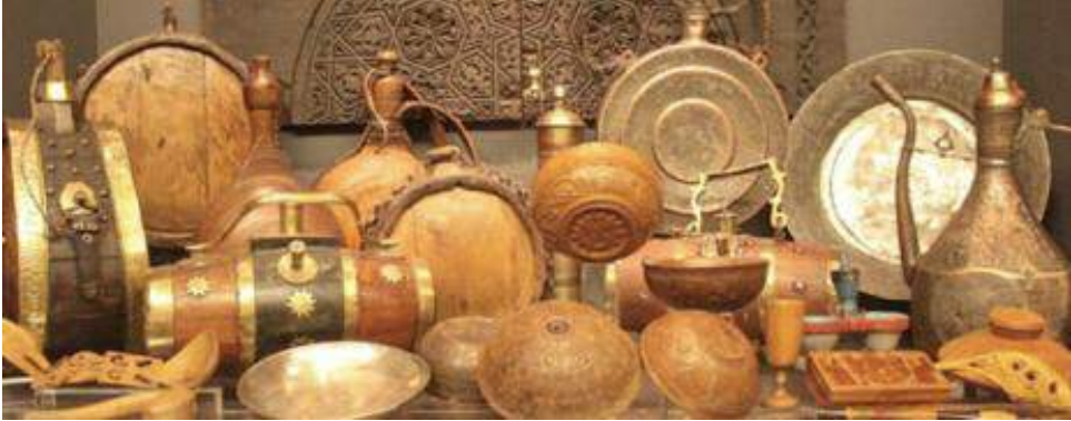
Παραδοσιακά σκεύη από τις συλλογές του Λαογραφικού Μουσείου

φικής και γλυπτικής, φιγούρες του θεάτρου σκιών), αλλά και αντικείμενα και έπιπλα που σχετίζονται με την ιστορία του συγκεκριμένου Μουσείου και με την ιστορία του ΑΠΘ, ενώ στο Σπουδαστήριο Λαογραφίας και Κοινωνικής Ανθρωπολογίας εκτίθεται και μια μικρή συλλογή μουσικών οργάνων. Το Μουσείο είναι ανοικτό στο κοινό, τους σπουδαστές και τους ερευνητές.