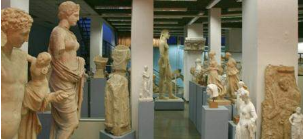
Μουσείο Εκμαγείων. Άποψη της αίθουσας Κ. Ρωμαίου

7.000 φωτογραφίες, εξυπηρετούν τομείς της έρευνας μεταπτυχιακών φοιτητών, υποψήφιων διδασκόντων και ερευνητών, αλλά και δράσεις των φοιτητών του Τμήματος στο πλαίσιο της πρακτικής τους άσκησης. Η λειτουργία και οι δραστηριότητες του Μουσείου στους εκθεσιακούς χώρους και το μικρό του αμφιθέατρο έχουν σκοπό κυρίως ερευνητικό και εκπαιδευτικό με την οργάνωση ξεναγήσεων για φοιτητές. Ταυτόχρονα, όμως, απευθύνονται και στο ευρύτερο κοινό με την πραγματοποίηση εκπαιδευτικών προγραμμάτων για μαθητές της πρωτοβάθμιας και Δευτεροβάθμιας Εκπαίδευσης, αλλά και ξεναγήσεων για το ενήλικο κοινό.