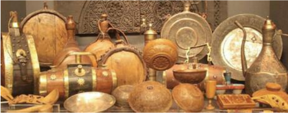
Παραδοσιακά σκεύη από τις συλλογές του Λαογραφικού Μουσείου

φικής και γλυπτικής, φιγούρες του θεάτρου σκιών), αλλά και αντικείμενα και έπιπλα που σχετίζονται με την ιστορία του συγκεκριμένου Μουσείου και με την ιστορία του ΑΠΘ, ενώ στο Σπουδαστήριο Λαογραφίας και Κοινωνικής Ανθρωπολογίας εκτίθεται και μια μικρή συλλογή μουσικών οργάνων. Το Μουσείο είναι ανοικτό στο κοινό, τους σπουδαστές και τους ερευνητές.