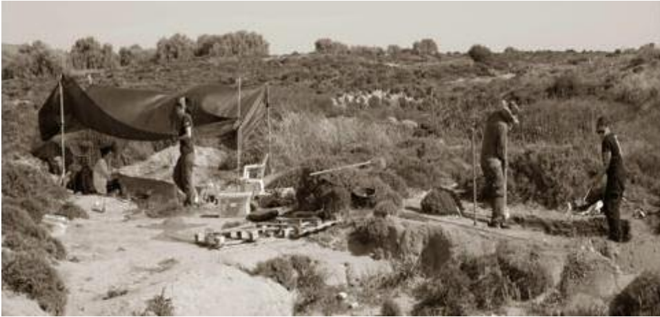
Η ανασκαφή της Παλαιολιθικής εγκατάστασης του 'Ούριακου' στη Λήμνο (11η χιλ. π.Χ.)