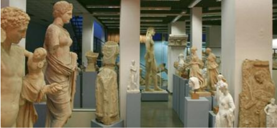
Μουσείο Εκμαγείων. Άποψη της αίθουσας Κ. Ρωμαίου

7.000 φωτογραφίες, εξυπηρετούν τομείς της έρευνας μεταπτυχιακών φοιτητών, υποψήφιων διδασκτόρων και ερευνητών, αλλά και δράσεις των φοιτητών του Τμήματος στο πλαίσιο της πρακτικής τους άσκησης. Η λειτουργία και οι δραστηριότητες του Μουσείου στους εκθεσιακούς χώρους και το μικρό του αμφιθέατρο έχουν σκοπό κυρίως ερευνητικό και εκπαιδευτικό με την οργάνωση ξεναγήσεων για φοιτητές. Ταυτόχρονα, όμως, απευθύνονται και στο ευρύτερο κοινό με την πραγματοποίηση εκπαιδευτικών προγραμμάτων για μαθητές της πρωτοβάθμιας και Δευτεροβάθμιας Εκπαίδευσης, αλλά και ξεναγήσεων για το ενήλικο κοινό.