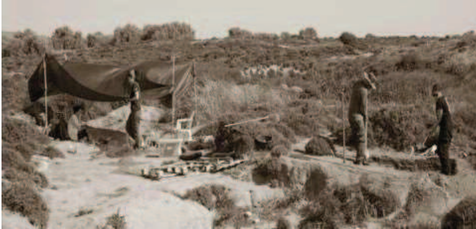
Η ανασκαφή της Παλαιολιθικής εγκατάστασης του 'Ούριακου' στη Λήμνο (11η χιλ. π.Χ.)